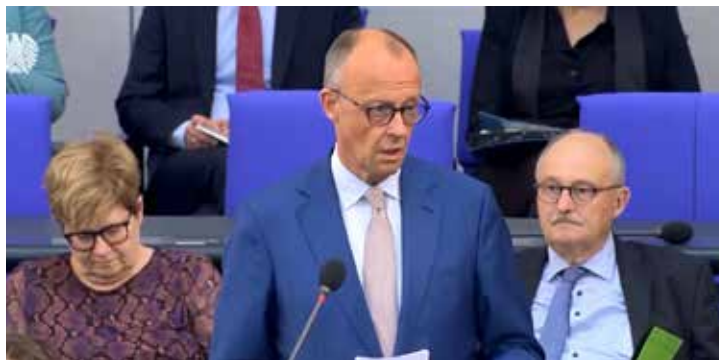
Bundeskanzler Merz bei der Kanzlerbefragung

Der Stahlhändler Gerber Steel aus dem badischen Riegel wagte als einer der ersten, seine „politische Neigung“ zur AfD zu outen.