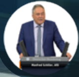
Manfred Schiller: ein Weidener im Bundestag