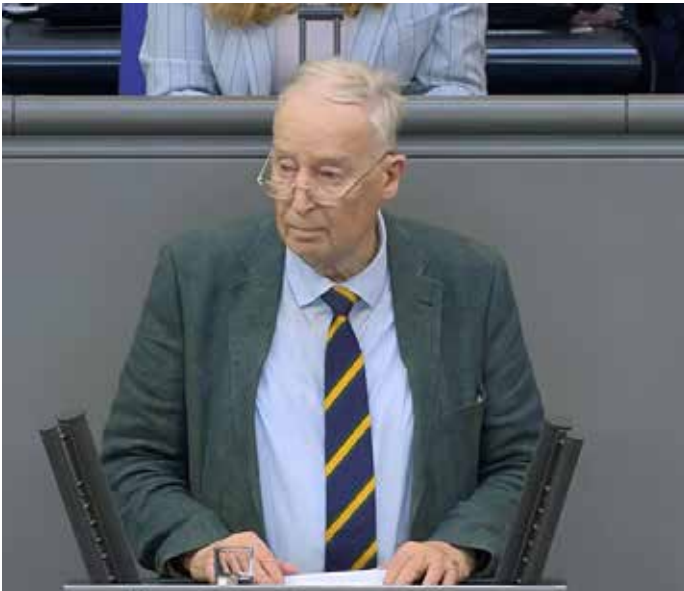
Dr. Alexander Gauland während seiner Rede

Aber deutsche Waffen, Bomben und Drohnen werden