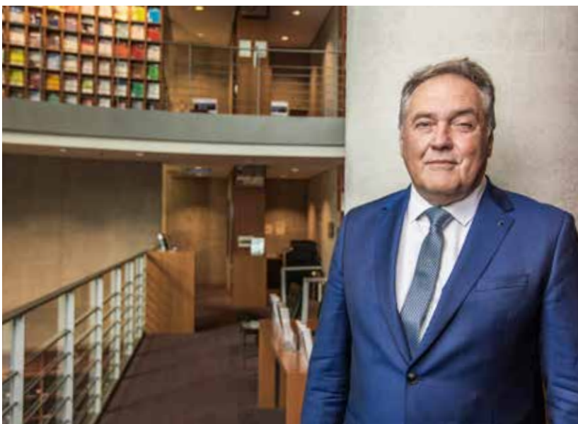
Im Deutschen Bundestag

Am Mittwoch hatte unsere Fraktion die Dr.-Nr. 21/6636 „ Neue Wirtschaftskraft entfesseln – Bürger und Unternehmen entlasten “ in erster Lesung im Plenum. Der Antrag ist die Umsetzung des Positionspapiers