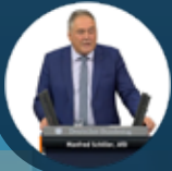
Manfred Schiller: ein Weidener im Bundestag