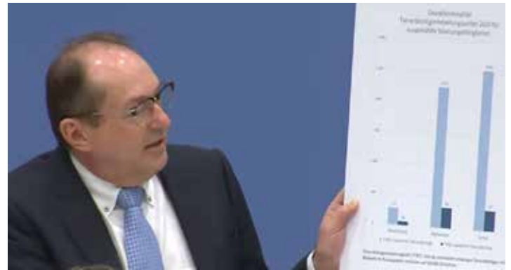
Innenminister Dobrindt bei der Vorstellung der Polizeilichen Kriminalstatistik (mehr dazu auf Seite 3)

formiert , das Sozial- und Gesundheitssystem werden